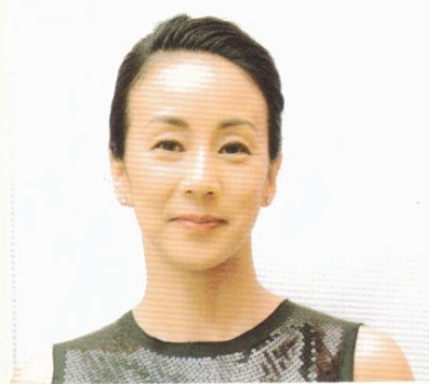
ソフトオールバック

洋服によってはアップスタイルにしたいことも。ドライヤーで全体をふんわりさせて、ヘアピンで後ろに後ろに小さくまとめていけば、はい、でき上がり！