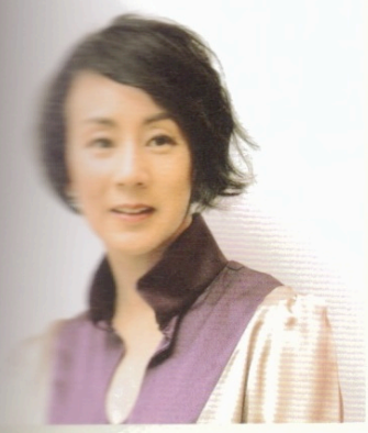
美造作がおしゃれ！ ニュアンスヘア

アイロンで全体に軽くウエーブをつけた後(短いので、巻くところまではいきませんが)、スプレーをかけて適当に手でぐちゃっと押さえて潰します。ポンメトリーでOK！ ブラウス/レクイエム