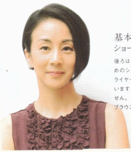
基本の ショートボブスタイル

後ろはかなり短めで前の方が長めのショートボブ。洗った後にドライヤー、仕上げにアイロンを使います。ブラシはまったく使いません。 ブラウス/ゾー&ネマ