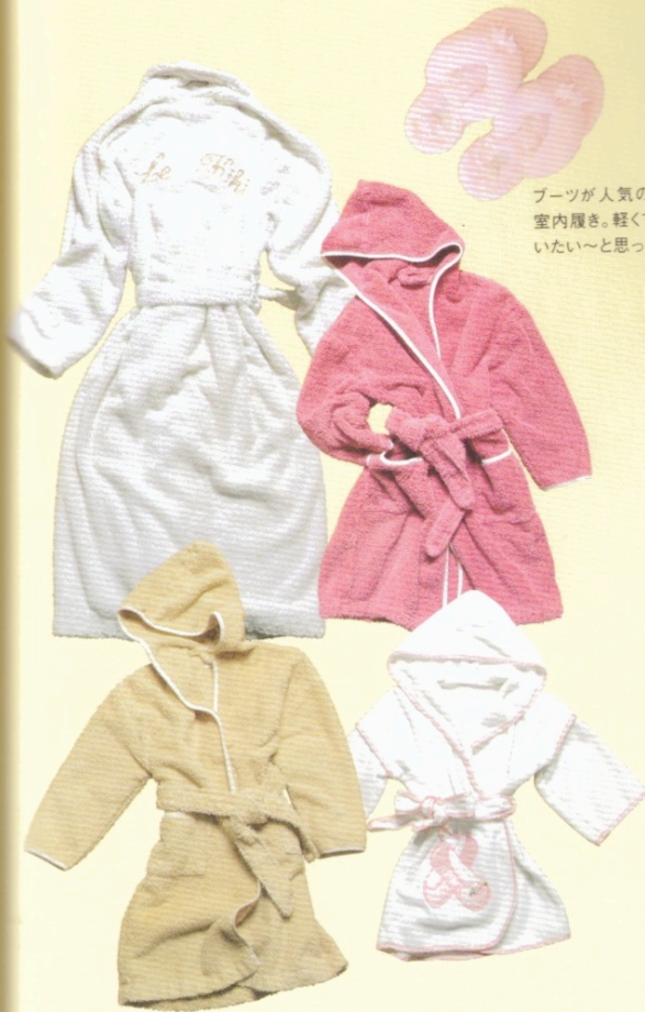
ブーツが人気のオーストラリアのアグの 室内履き。軽くてふわふわ。ずっと履いて いたい〜と思ってしまいます。

「信じられない フランスの友 ていました。と ちは強制的に に「寝る時くら いのに…」と ま寝てます。 「違います、 5」スタイルで のセーターで +ブルーのノ 太めのヒール のショートパ