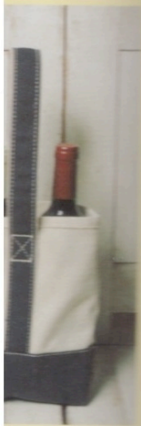
トート、パーティヤビ 自分のイニシャルがス ーターを入れてもいい

「信じられない フランスの友 ていました。と ちは強制的に に「寝る時くら いのに…」と ま寝てます。 「違います、 5」スタイルで のセーターで +ブルーのノ 太めのヒール のショートパ