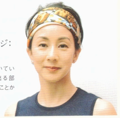
スカーフを使うアレンジ： ヘアバンド風

スカーフの前に2、3本幅広のブリーツを寄せて、比較的低い位置で結びます。ヴァカンス先で登場。 ニット/レクイエム スカーフ/エルメス