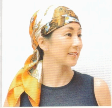
スカーフを使うアレンジ： パイレーツ巻き

後ろはかなり短めで前の方が長めのショートボブ。洗った後にドライヤー、仕上げにアイロンを使います。ブラシはまったく使いません。 ブラウス/ゾー&ネマ